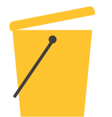
IMBALLAGGI IN PLASTICA E METALLI