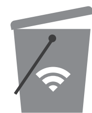
RIFIUTO URBANO RESIDUO